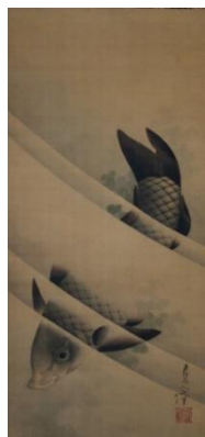
③葛飾北斎「遊鯉図」 江戸時代 天保10年（1839）