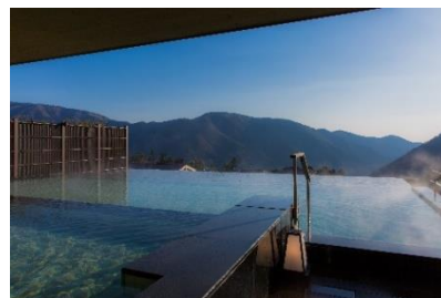
6階大浴場「浮雲の湯」露天風呂