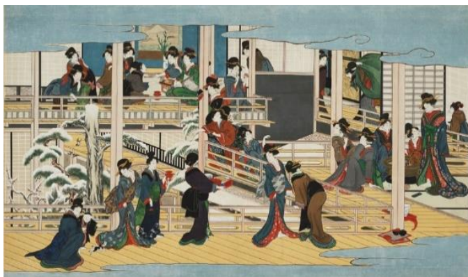
④喜多川歌麿「深川の雪」江戸時代 享和2～文化3年（1802～06）頃