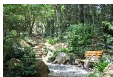
6月～ 森林浴に最適な季節