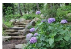
7月～ 色とりどりの紫陽花