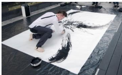
2020年8月29日に開催したイベントの様子

現代の日本画家・福井江太郎氏が、風神・雷神の大壁画「風・刻（かぜ・とき）」の前で、金箔地のパネルに作品を描き上げるライブパフォーマンスです。椅子席の応募は定員に達しました。尚、当日椅子席のご用意はできませんが、イベントをご覧いただくことは可能です。※混雑状況によりお断りさせていただく場合もありますので、あらかじめご了承ください。