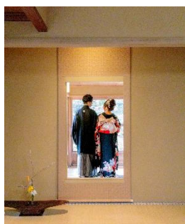
「開化亭」床の間の借景