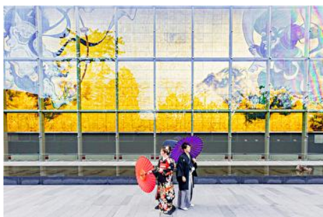
③風神・雷神の大壁画「風・刻」前