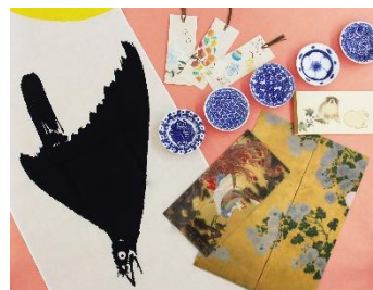
ミュージアムグッズ例