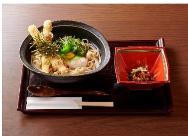
開化亭メニュー例