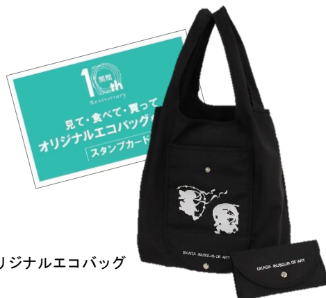
①オリジナルエコバッグ