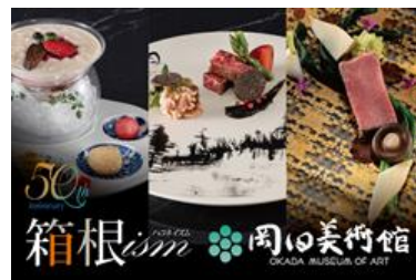
②エクシブ箱根離宮×岡田美術館 コラボレーションメニュー