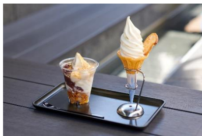
足湯カフェメニュー例