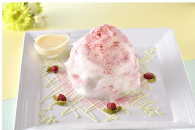
「ふわふわベリどらパンケーキ～わたあめ包み～」 1,500円（税込） コーヒー付 【1日限定10食】

今春開催の『箱根スイーツコレクション 2020』に、当館の飲食施設「開化亭」が参加します。今回のテーマ「満開♡フラワースイーツ」に合わせて、「和がし 葉な」とコラボレーションした「ふわふわベリどらパンケーキ～わたあめ包み～」を期間限定で提供いたします。ストロベリーシュガーをまとった綿あめにアングレースソースをかけると、中からどら焼きパンケーキが現れます。強火力でふわっふわに焼き上げたパンケーキにはラズベリークリームとあずきクリームが挟まれ、綿あめの程よい甘さの中に酸味が広がる絶妙なバランス。ムービージェニック（動画映え）なスイーツとしても楽しめます。