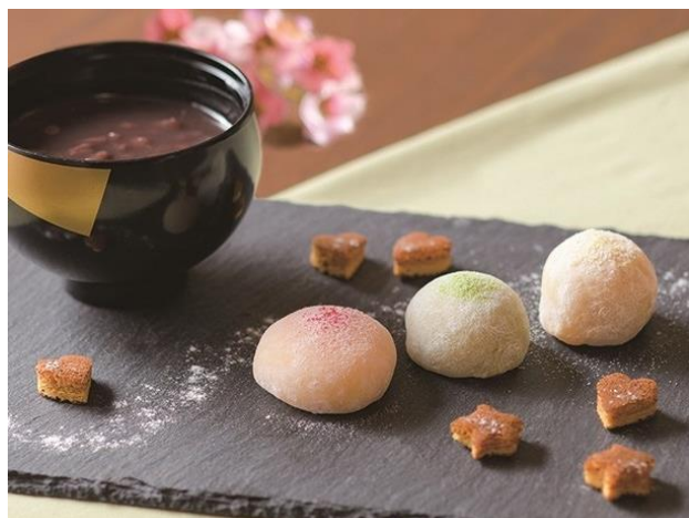
ほっこりおしるこ 3種の大福と共に（煎茶付）

今春開催の『箱根スイーツコレクション 2019 春』に、当館の飲食施設「開化亭」が参加します。今回のテーマ「恋する乙女スイーツ」に合わせて、「和がし 葉な」とコラボレーションした「ほっこりおしるこ 3種の大福と共に」を期間限定で提供いたします（税込1,000円）。