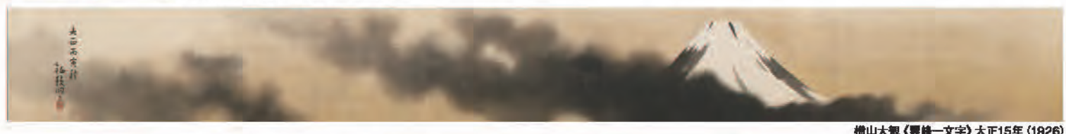
横山大観《麗峰—文字》大正15年(1926)

会期中のイベント [会場] 5階ホール [定員] 80名 [参加費] 無料(要入館料)