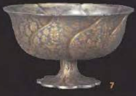
Fifth Anniversary Exhibition All-Stars of the Okada Collection: