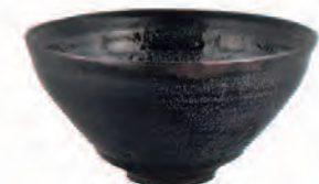
《油滴天目茶碗》建窯 中国・南宋時代 12~13世紀