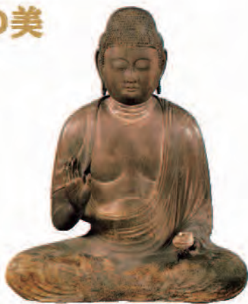
重要文化財 《木造師範如来坐像》 平安時代 11世紀