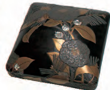
伝 尾形光琳《樟若松菊輪縁御椀》 江戸時代 18世紀