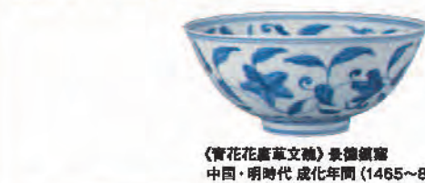
《青花花鳥草文鉢》景徳鎮窯 中国・明代 成化年間(1465~87)