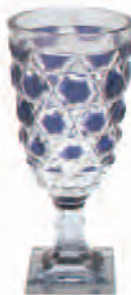
《蘭摩切子紫色板脚付杯》 江戸時代 19世紀