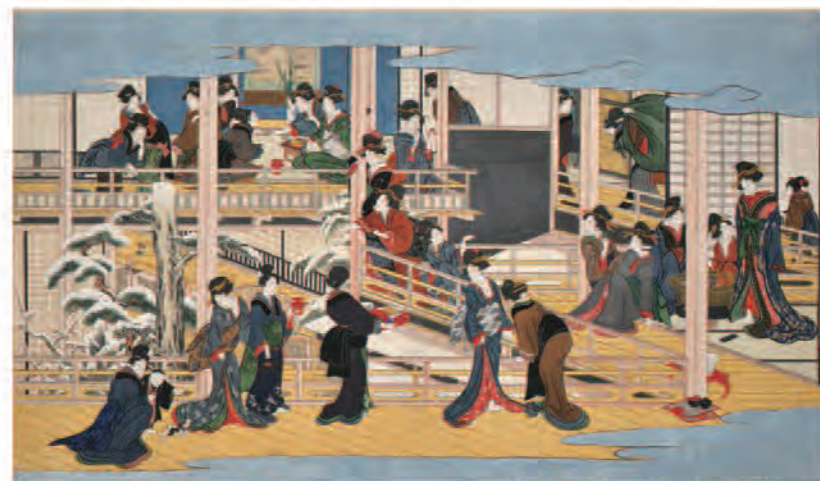
喜多川歌麿《深川の雪》江戸時代 享和2~文化3年(1802~06)頃【展示期間 9/30(日)~12/28(金)】