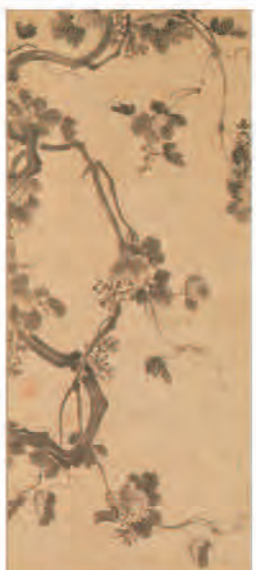
正祖(李祘)《葡萄園》 韓国・朝鮮時代 18世紀後半