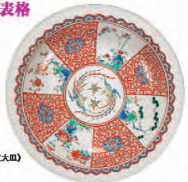
《色繪松竹梅牡丹双鳳文大皿》 有田・神右衛門様式 江戸時代 17世紀後半