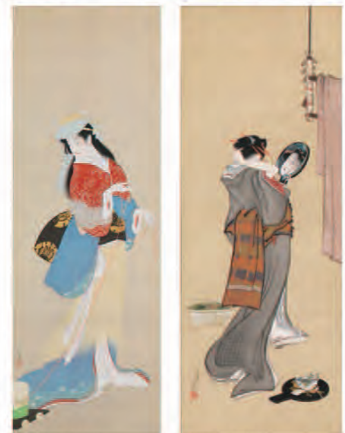
上村松園《沙くみ》 昭和16年(1941)