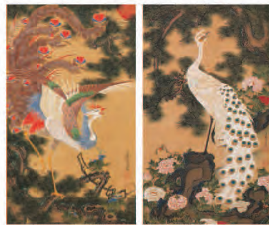
伊藤若沖《孔雀鳳凰図》江戸時代 宝暦6年(1756)頃 【展示期間 9/30(日)~10/10(水)、12/29(土)~3/30(土)】