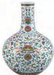
《豆彩八吉祥唐草文天球瓶》景徳鎮窯 中国・清時代 乾隆年間(1736~95)

岡田美術館は、2013年10月に箱根・小涌谷に誕生して以来、日本と中国・韓国の壮麗な美の歴史を実感し楽しめる美術館を目指し、収蔵品を中心に14本の展覧会を開催してまいりました。このたび、開館5周年を記念して、これまでの展示活動の集大成となるベストコレクションを展覧いたします。