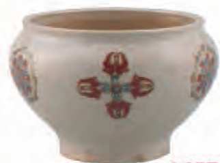
重要文化財 野々村仁清《色繪繪宝箱唐文香炉》 江戸時代 明暦3年(1657)