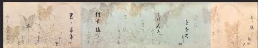
Masterworks of Kōrin, Jakuchū, Hokusai and the Ru Ware Kilns