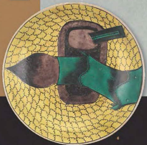
Masterworks of Kōrin, Jakuchū, Hokusai and the Ru Ware Kilns