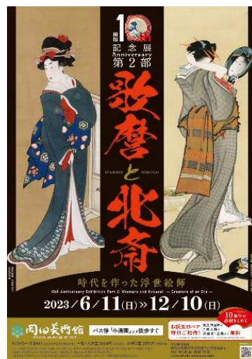
②メインビジュアル