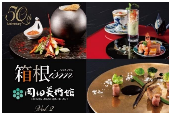
⑥エキシブ箱根離宮×岡田美術館 コラボレーションメニューvol.2