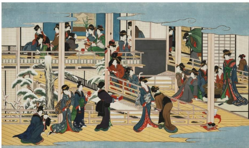
①喜多川歌麿「深川の雪」江戸時代 享和2～文化3年（1802～06）頃

そしていよいよ9月8日からは、歌麿晩年の傑作「深川の雪」を公開いたします（9月7日以前は高精細複製画を展示）。現存する歌麿の肉筆画は世界に約40件ともいわれる中、2012年に奇跡的に再発見され当館の収蔵となった本作品。今回は、絵の中に隠された意味や謎について読み解く展示となり、新たな魅力に出会えるはずです。