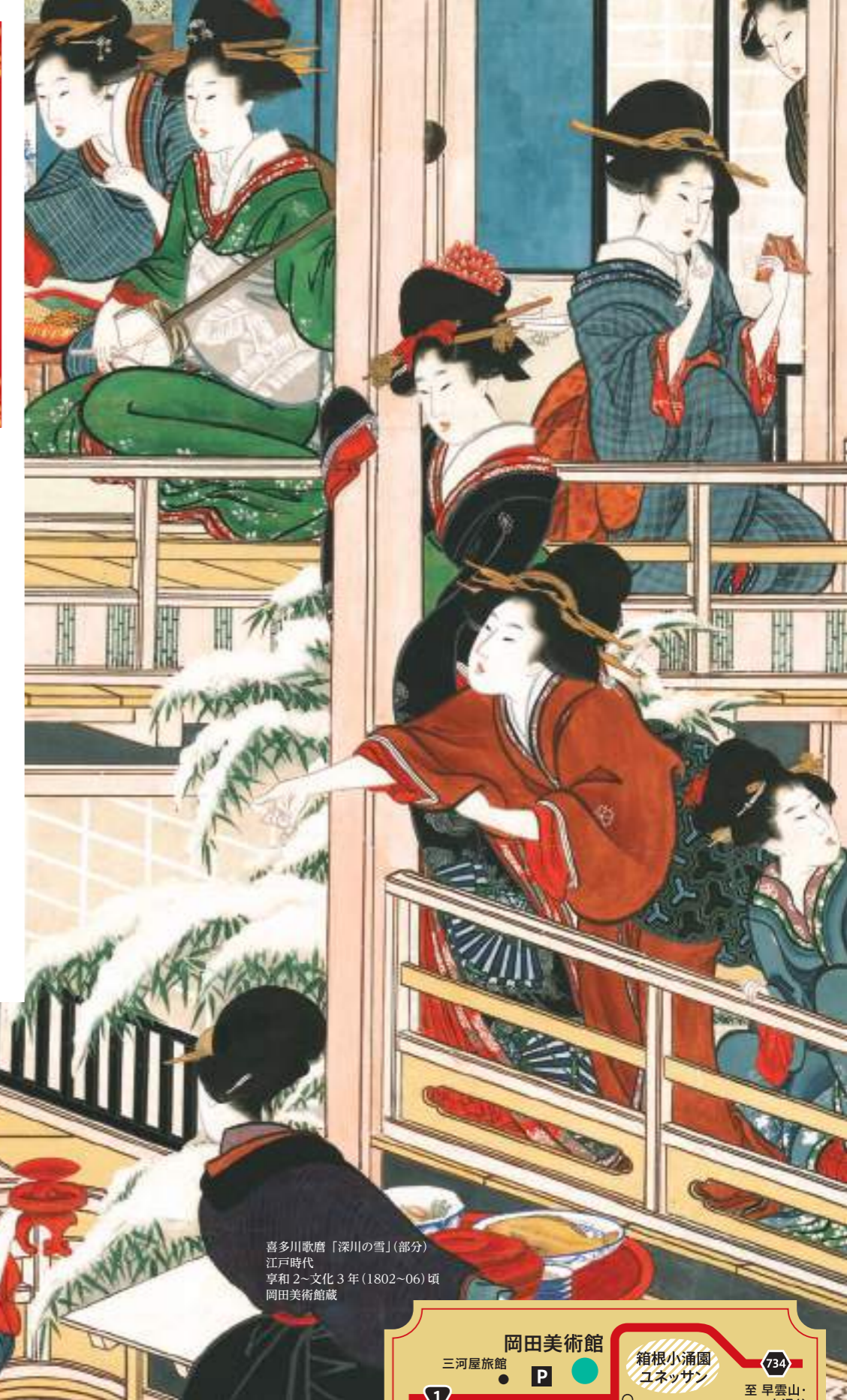
喜多川歌麿「深川の雪」(部分) 江戸時代 享和2~文化3年(1802~06)頃 岡田美術館蔵

歌麿大作 Utamaro's Masterpieces Reunited: Fukagawa in the Snow and Cherry Blossoms at Yoshiwara Together after 138 Years 深川の雪と吉原の花 アメリカ(ワズワース・アセーニウム美術館)より来日 138年ぶりの夢の再会