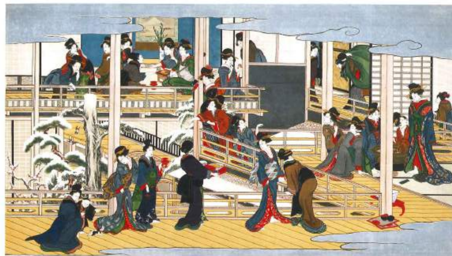
喜多川歌麿「深川の月」江戸時代 享和2-文化3年(1812-05)頃 岡田美術館蔵