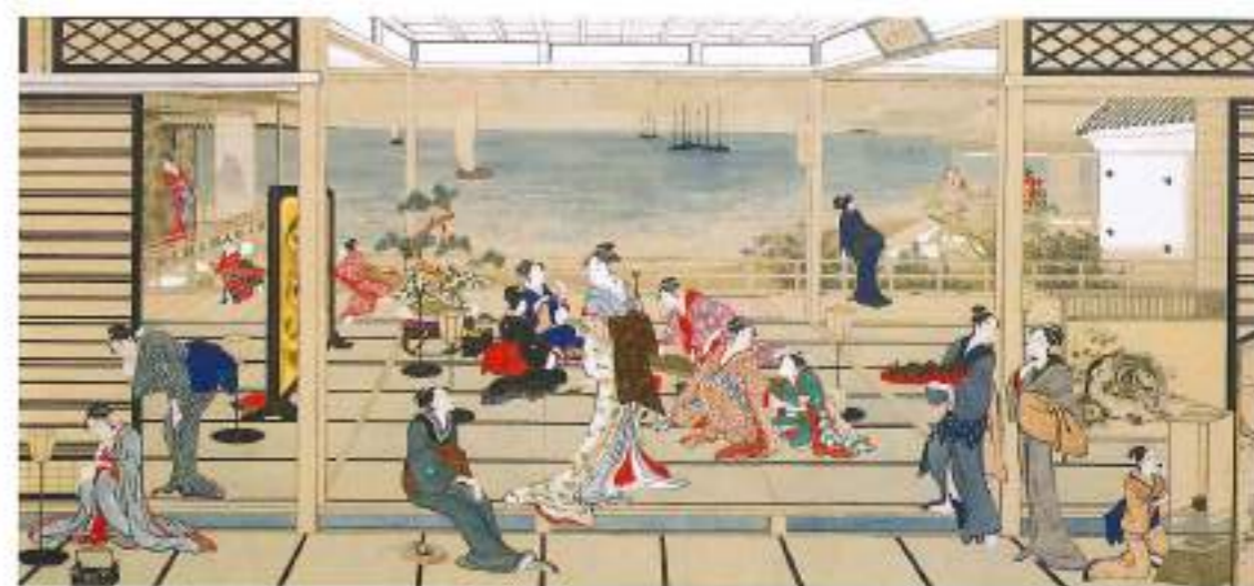
©Kitagawa Utamaro "Moon at Shinagawa" (Original: Freer Gallery of Art, Smithsonian Institution, Washington, D.C.; GD of Charles Lang Freer, F1903.54. 喜多川歌麿「品川の月」 原本:フリーア美術館蔵(アメリカ・ワシントンD.C.) / 原寸大の高精細複製画を同時展示